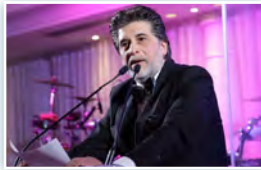
MOT DU PRÉSIDENT PAGE 2