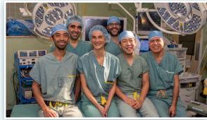
PROJET D'AVENIR ANNONCÉ PAGE 4