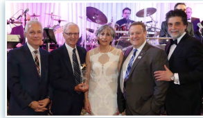
LES ÉVÉNEMENTS 2018-2019 PAGE 6