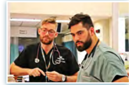
SANTA CABRINI EN CHIFFRES PAGE 9